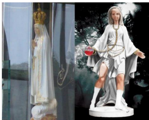
Patung Fatima dan Gambar Apa yang Dilihat Anak-Anak pada Tahun 1917

Mungkinkah penampakan di Fatima adalah Maria atau putri Muhammad?