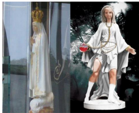
تمثال فاطمة وصورة لما شاهده الأطفال سنة 1917

هل من الممكن أن يكون الظهور في فاطمة هو ظهور مريم أو ابنة محمد؟